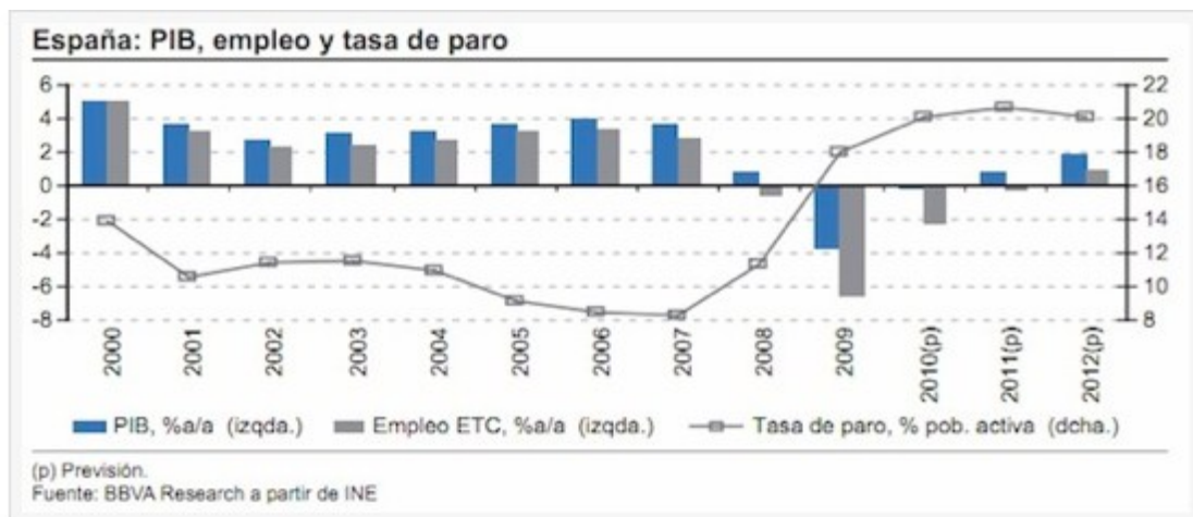
Gráfica. Evolución del PIB, empleo y tasa de paro en España.

En pocos años, España generó 2,4 millones de puestos de trabajo y contruyó la misma cantidad de viviendas que Francia, Alemania e Italia conjuntamente. Las empresas inmobiliarias ofertaban miles de viviendas que tenían una gran acogida por los compradores e inversionistas, gracias al apoyo crediticio de las entidades financieras. Los bancos y cajas de ahorros ofrecían sus productos financieros con unos intereses bajos y unas exigencias mínimas a la hora de otorgar los créditos. Era la época del llamado “Boom inmobiliario”.